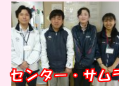
センター・サムラ